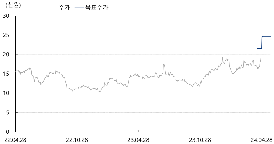
한화시스템 최근 2년간 목표주가 변동추이